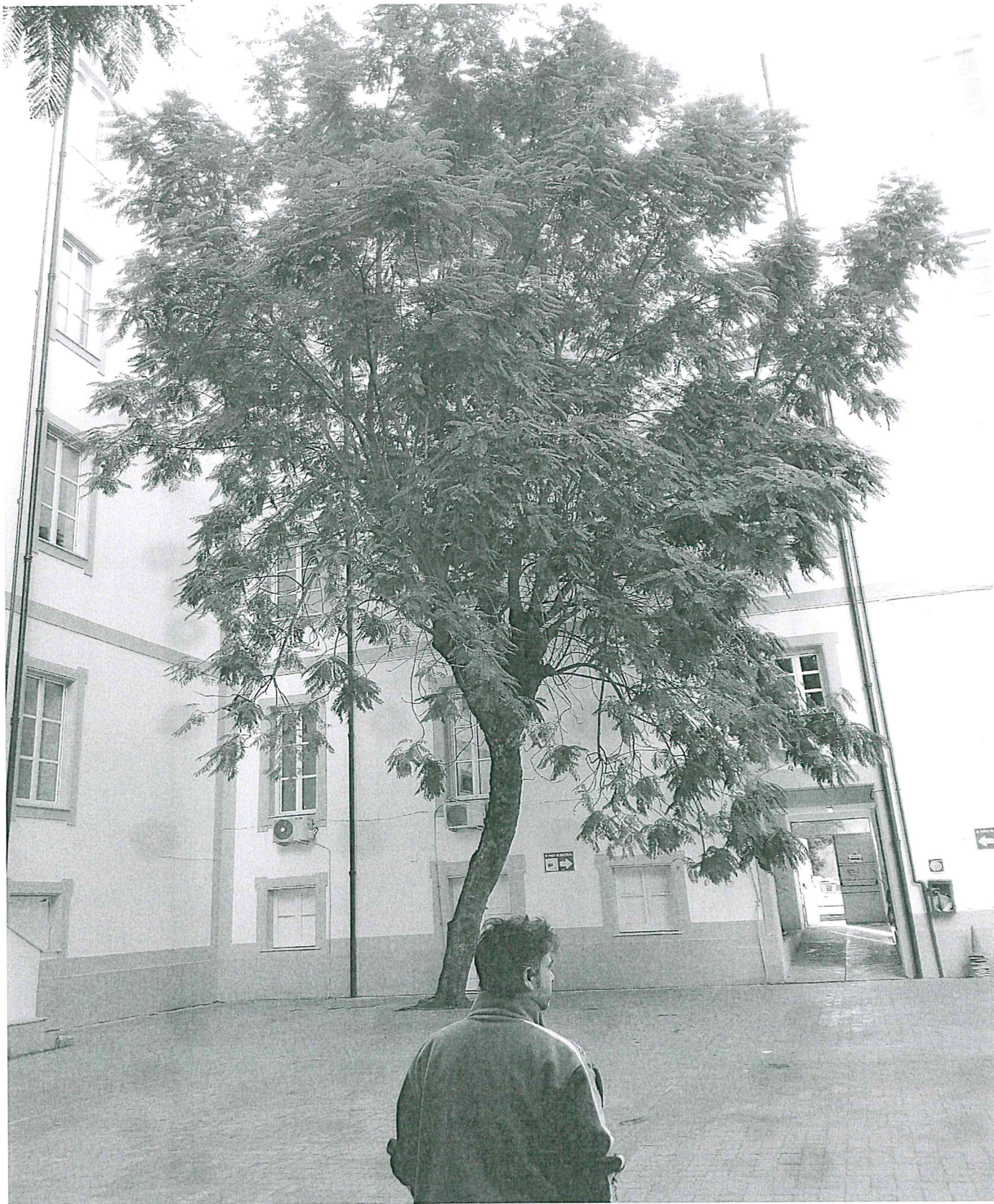
ISTITUTO BENEDETTO CROCE Via Benfratelli - Palermo