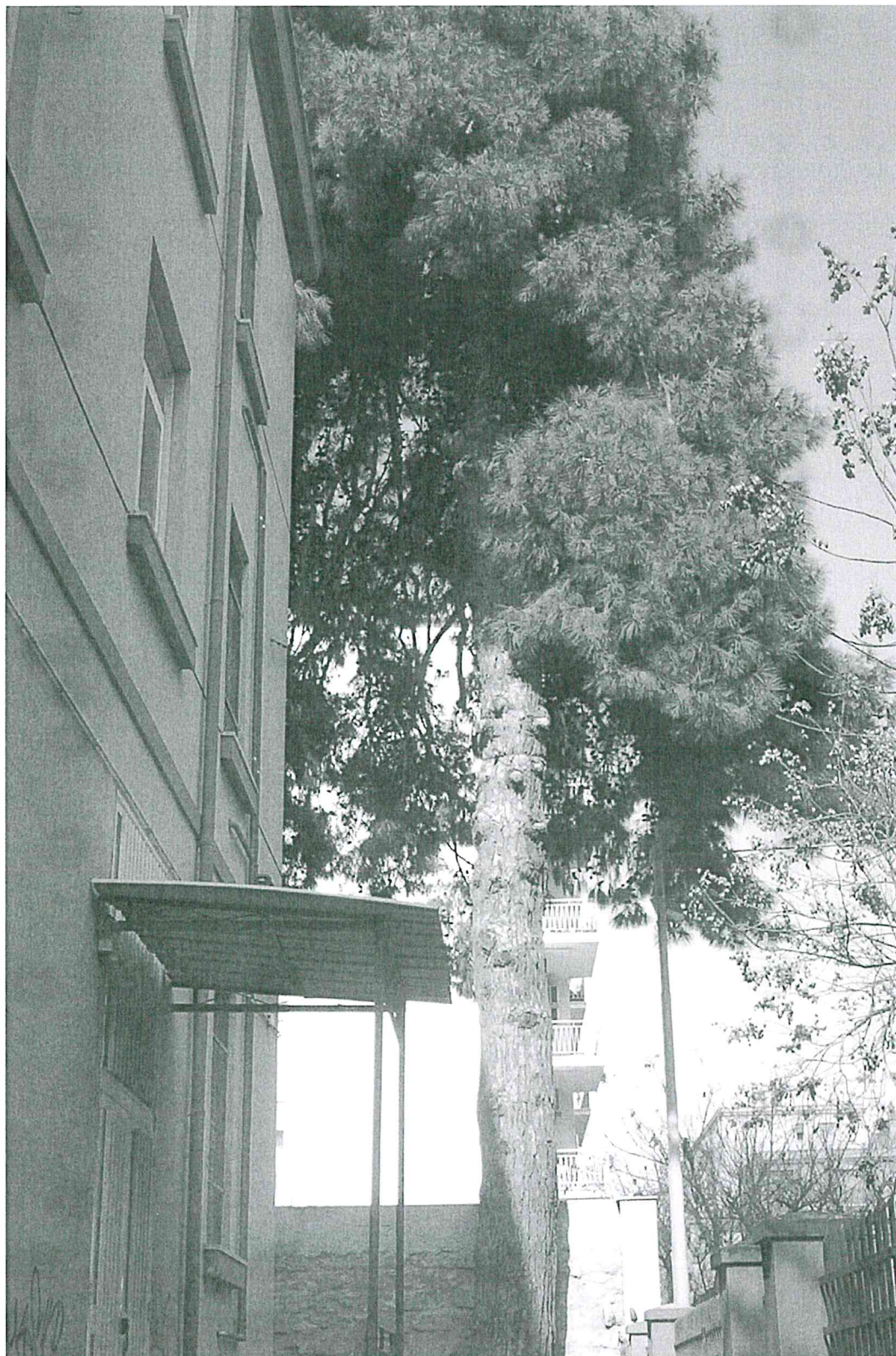
LICEO CLASSICO UMBERTO I° Via F. Parlatore - Palermo