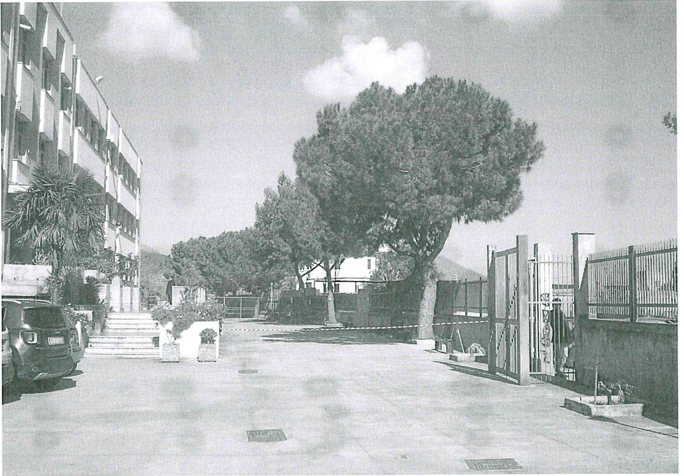
ITI E. "MAJORANA" Via G. Astorino, n° 56 - Palermo