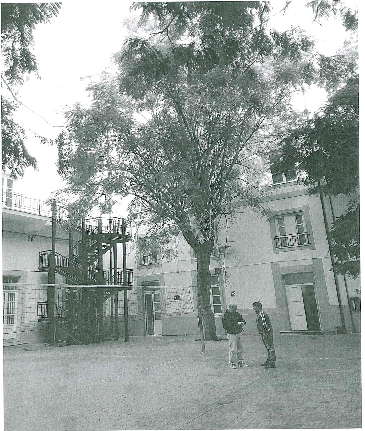
ISTITUTO BENEDETTO CROCE Via Benfratelli - Palermo