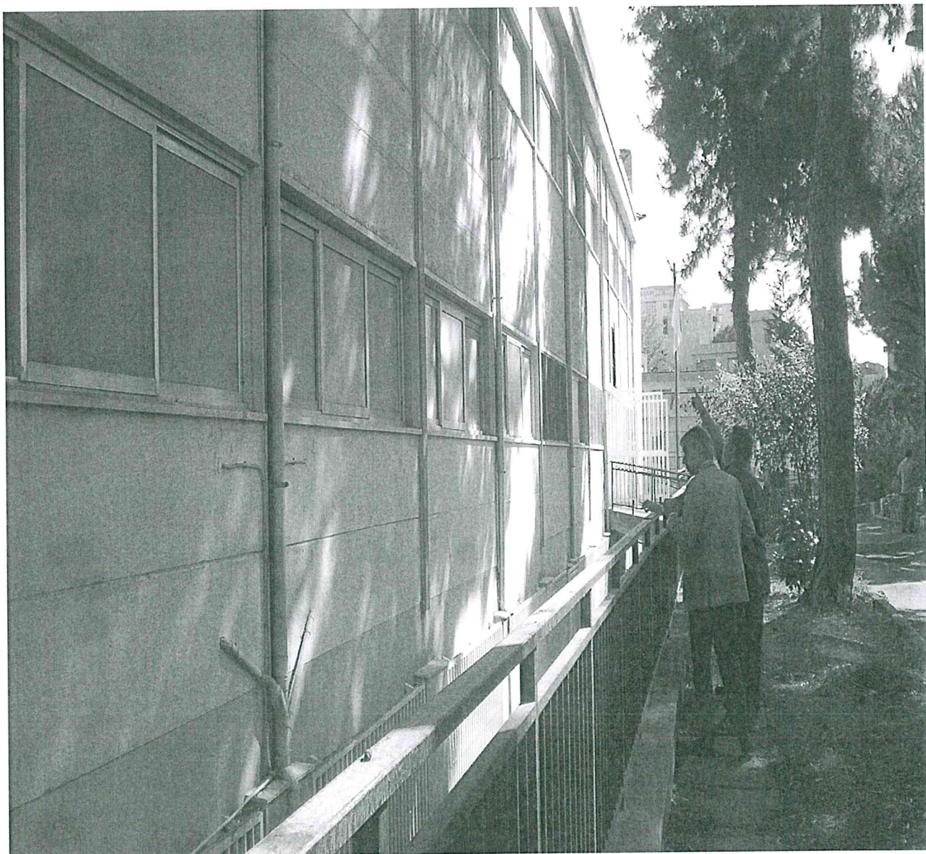
ISTITUTO D'ARTE D'ALEO VIA U. GIORDANO - MONREALE