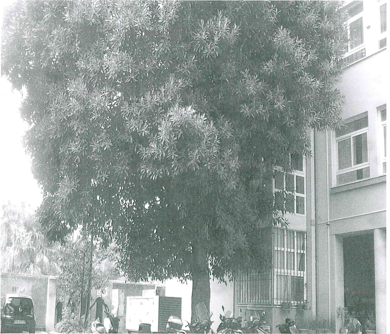
LICEO CLASSICO UMBERTO I° Via F. Parlatore - Palermo