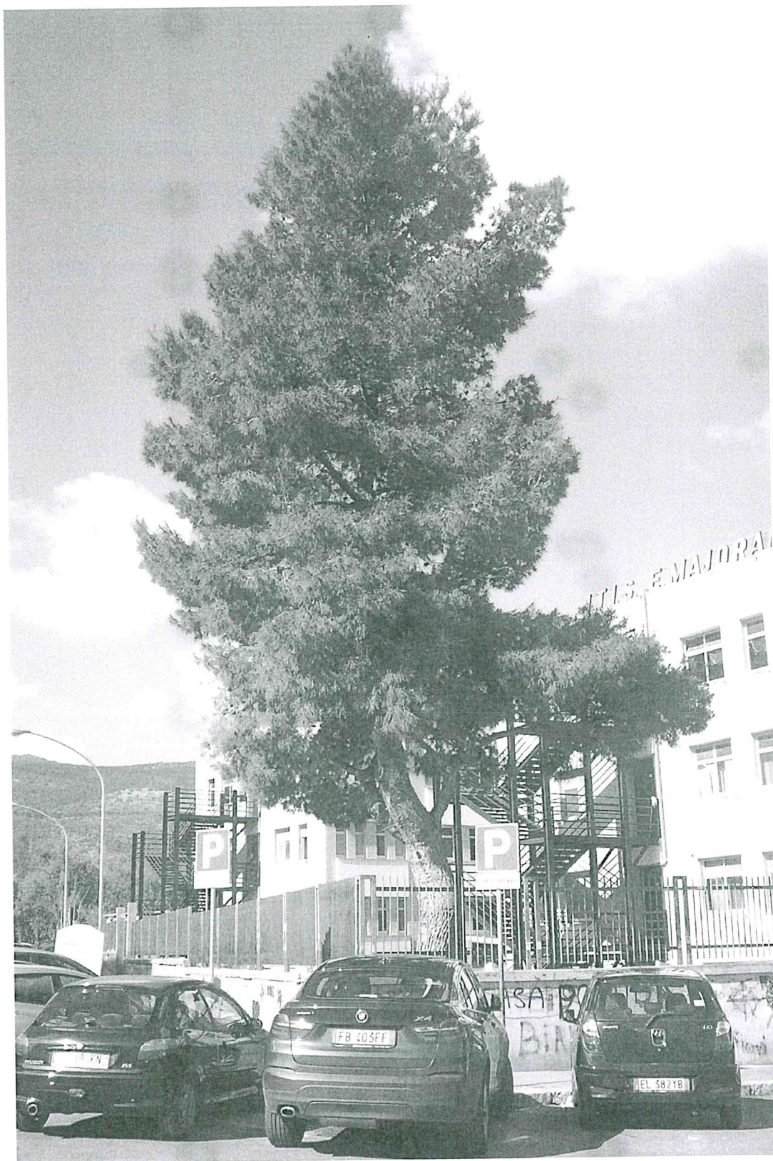
ITI "E. MAJORANA" Via G. Astorino, n° 56 - Palermo