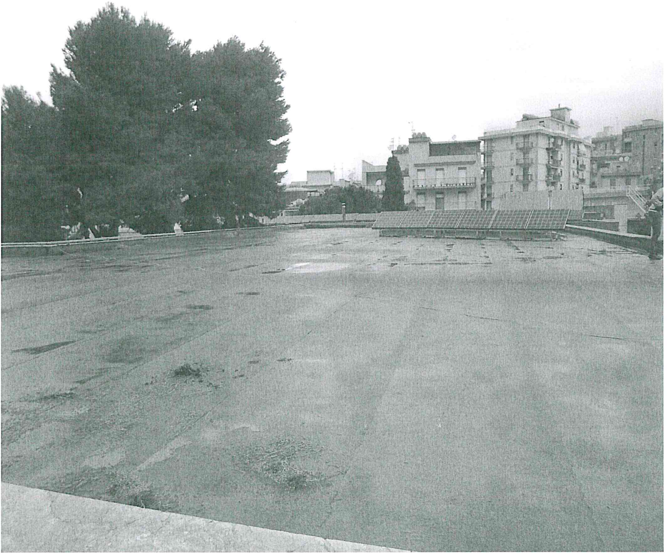
ISTITUTO “ G. UGDULENA” Via Del Mazziere – Termini Imerese (PA)