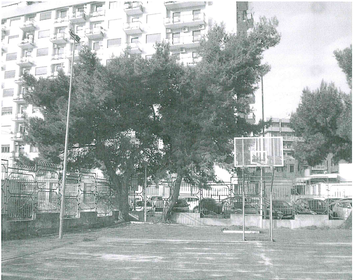
ISTITUTO FINOCCHIARO APRILE Via Cilea - Palermo