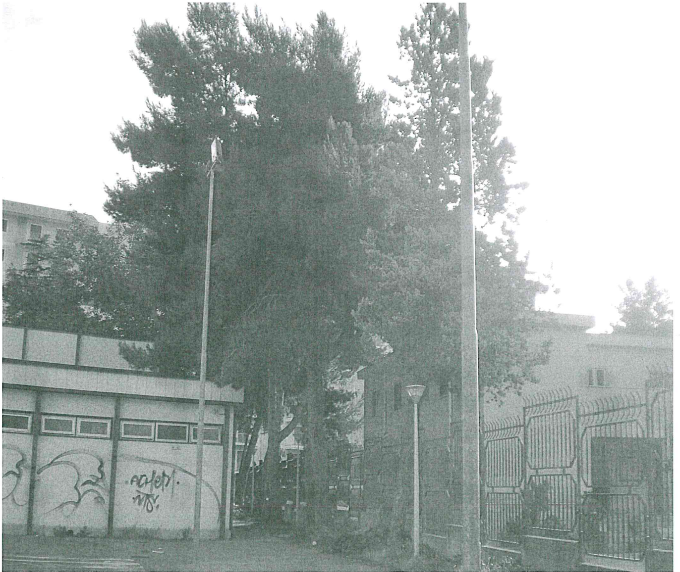
ISTITUTO FINOCCHIARO APRILE - Via Cilea - Palermo