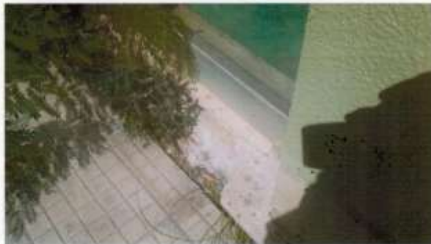
fascia basamentale dei muri esterni e soglie delle aperture al piano terra