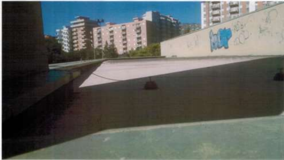
scorci di copertura sui quali si prevedono interventi per la impermeabilizzazione