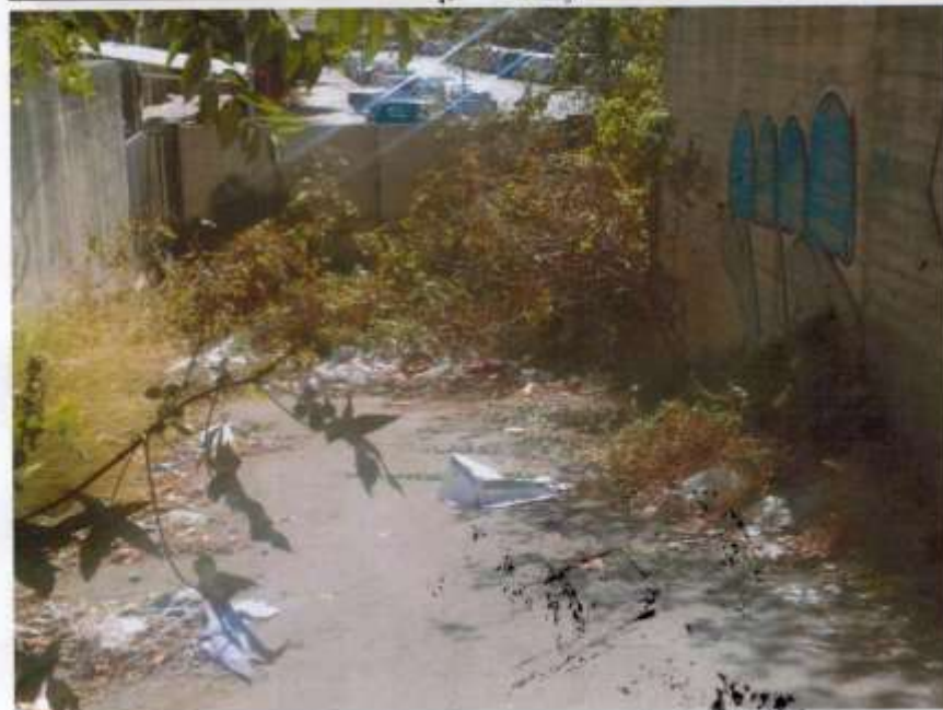
ripristino dell'uscita posteriore del complesso scolastico su Via E. Arculeo