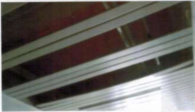
riparazione del controsoffitto e sostituzione di apparecchi illuminanti lungo alcune vie di esodo