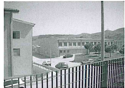
via E. Majorana – Marineo