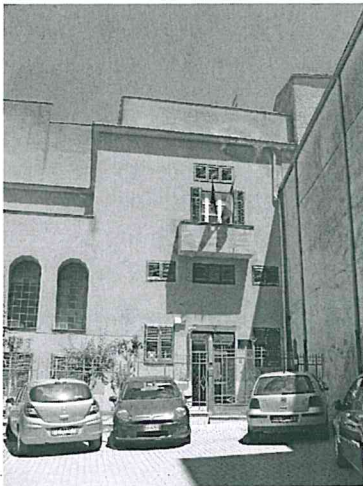
via Umberto I° - Corleone